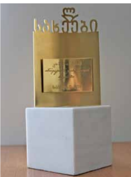
სარგებლობის საშუალება, რაც ყველა ჩვენგანის ჯანმრთელობის მდგომარეობის გაუმჯობესების გარანტია.

სასტუმრო „ქორთიარდ მარიოტში“ შეკრებილმა საზოგადოებამ ტრადიციულ საქველმოქმედო აუქციონშიც მიიღო მონაწილეობა, სადაც გასაყიდად ჩვენი დროების ცნობილი ადამიანების კუთვნილი ნივთები იყო გამოტანილი. აუქციონიდან შემოსული თანხა (23 000 ლარი) ას წელს გადამიჯებულ 75 უხუცესსა და ფერიცვალების დედათა მონასტერთან არსებულ პალიატიური მზრუნველობის ცენტრს მოხმარდება.