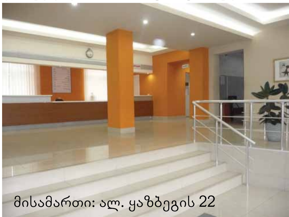
მისამართი: ალ. ყაზბეგის 22